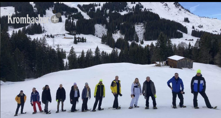
SKIREISE IN DIE KITZBÜHLER ALPEN