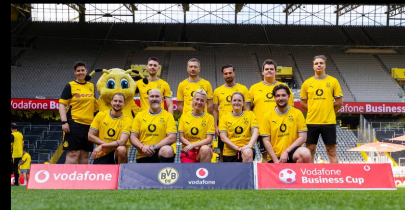
KICK IM SIGNAL IDUNA PARK